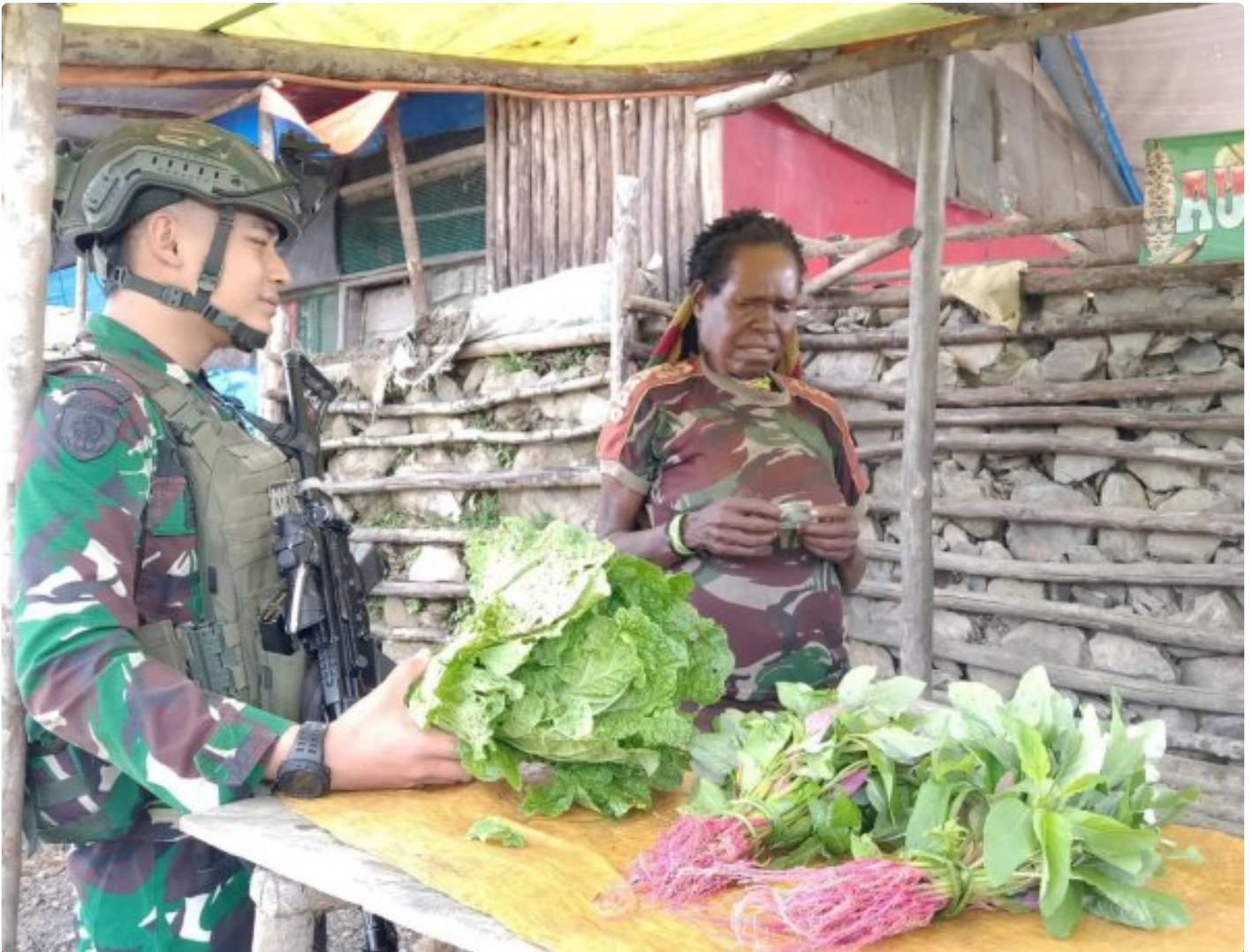
Prajurit TK Pintu Jawa Satgas Mobile Yonif 323/Buaya Putih Memorong hasil Tani mama Papua yang dijual di TK Pintu Jawa

Satgas Pamtas Mobile Yonif 323 Buaya Putih Kostrad TK Pintu Jawa melaksanakan kegiatan ROSITA, kegiatan ini bertujuan untuk membeli hasil tani